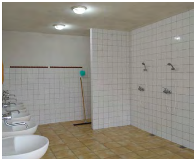
Umyváreň so sprchou.