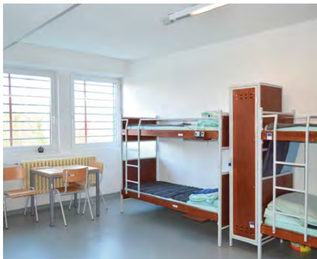
Izba pre odsúdených mužov.

Ak budeme hodnotiť vývoj koncepcie výstupného oddielu, môžeme konštatovať, že projekt Šanca na návrat vo svojich počiatkoch nadviazal na predchádzajúcu koncepciu výstupného oddielu (VO) tvoreného skupinou odsúdených s určenou diferenciačnou skupinou VO, ktorí boli nezávisle umiestnení v rôznych oddieloch v ústave. S touto skupinou boli s blížiacim sa koncom trestu vykonávané aktivity zamerané na prípravu odsúdených na plynulý prechod do občianskeho života. Tak tomu bolo ešte aj na začiatku roku 2019. Od spustenia projektu Šanca na návrat bolo jedným z cieľov a účelov projektu zriadenie výstupného oddielu ako špecializovaného oddielu v klasickom ponímaní, teda oddielu, kde sú odsúdení spoločne