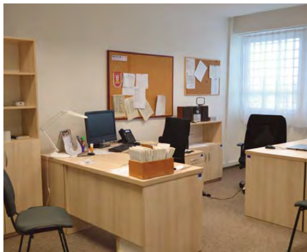
Kancelária pre personál.