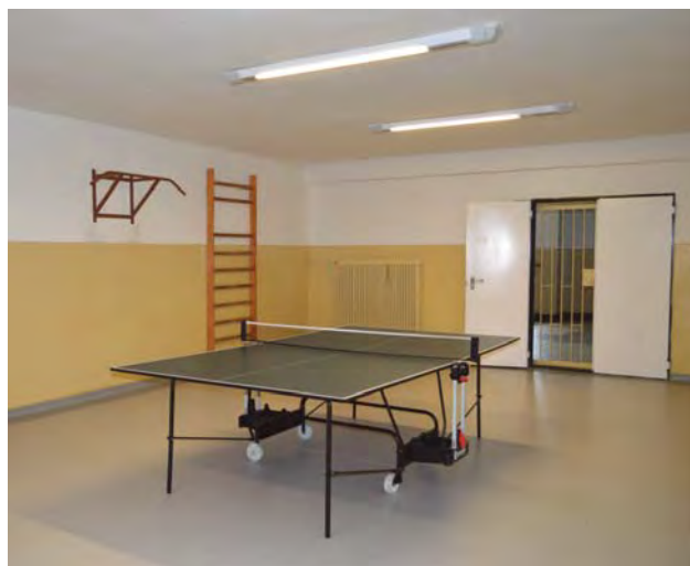
Priestor na športovanie.

materiálnych podmienok a vyššie opísanej zmeny koncepcie a jednak z progresívneho vývoja projektových dokumentov, štandardov, nástrojov a vzdelávacích programov.