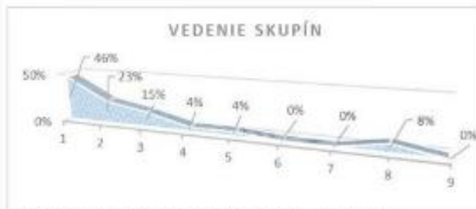
Graf 1: Určenie priority v tematickej oblasti Vedenie skupín.