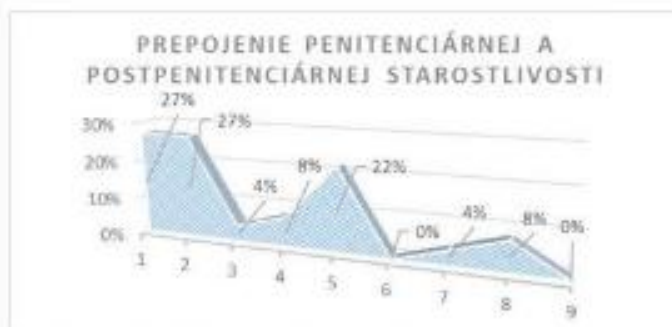
Graf 3: Určenie priority v tematickej oblasti Prepojenie penitenciárnej a postpenitenciárnej starostlivosti.