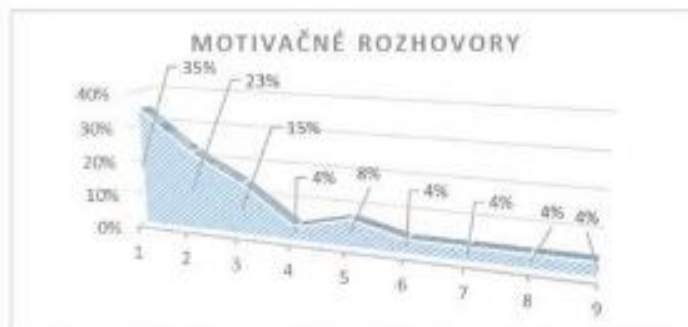
Graf 2: Určenie priority v tematickej oblasti Motivačné rozhovory.