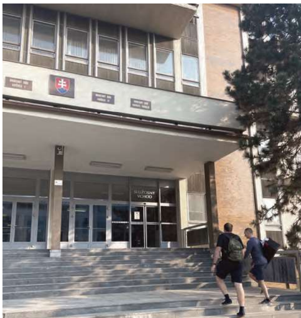
Príchod na súd.