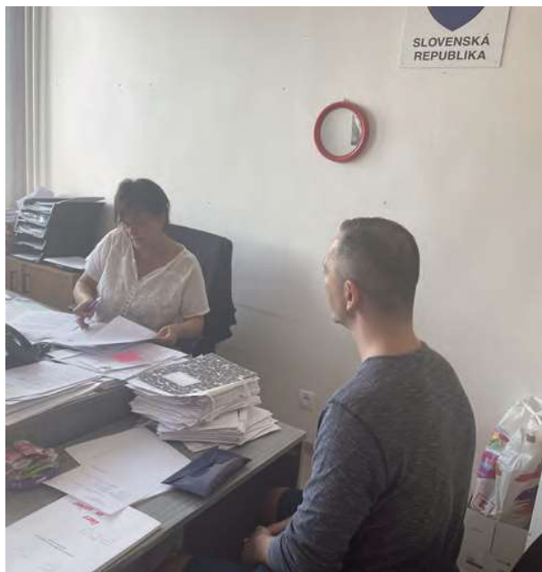
Návšteva sociálnej kurátorky pre plnoleté fyzické osoby.

Môžeme len konštatovať, že po piatich rokoch strávených za múrmi väznice išlo o celkom slušný balík povinností hneď