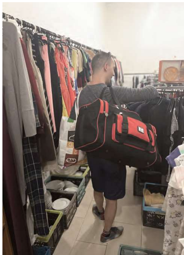
Odsúdený si po prepustení vyberá oblečenie a zariadenie do domácnosti v obchode Charity shop.