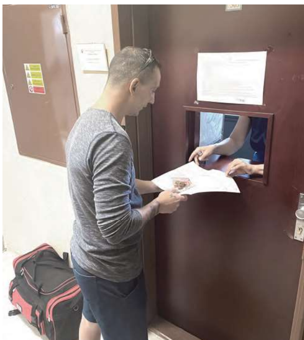
Vypĺcanie resocializačného príspevku na ÚPSVaR-e.