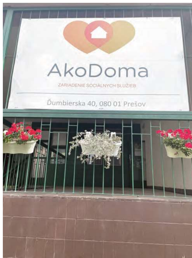
Vstup do zariadenia sociálnych služieb Domov na polceste D-partner v Prešove.