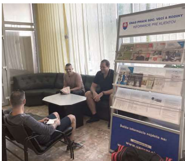
Čakanie na ÚPSVaR-e.