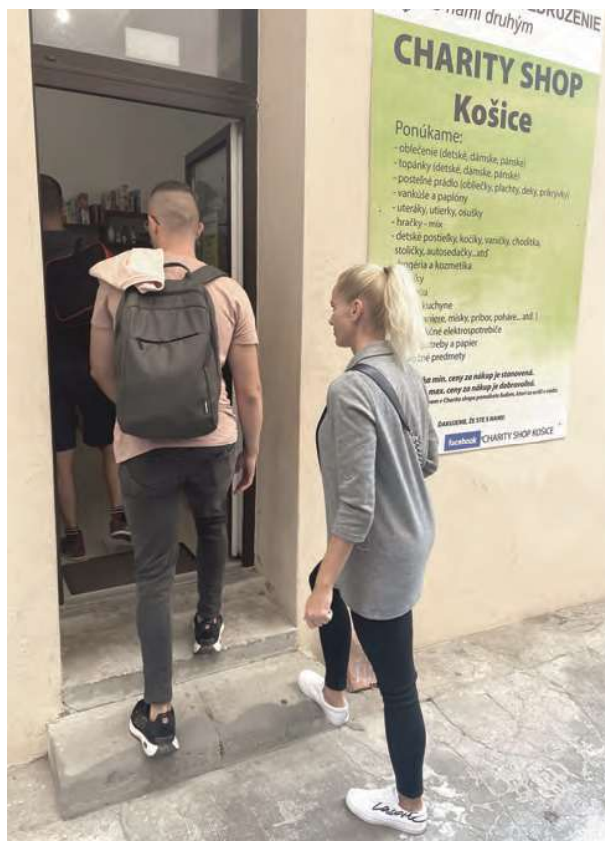
Vstup do Charity shopu.